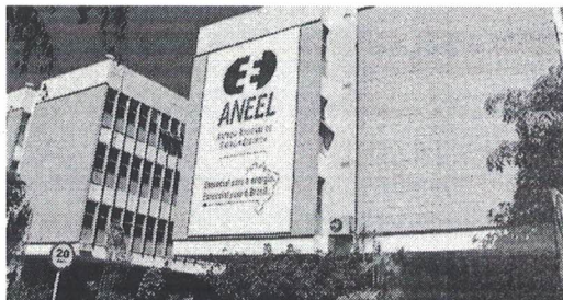
Reajuste tarifário de energia elétrica foi congelado por decreto assinado pelo presidente Bolsonaro

RECOMENDAÇÃO ■ No entanto, integrantes do conselho entenderam que isso seria uma "intervenção". Por isso, decidiram fazer a recomendação de acordos entre as partes definindo os termos da negociação. Às perdas estarão atreladas à chamada "conta-Covid" definida pelo decreto.